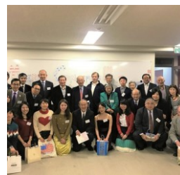
Happy Hour: such as a Christmas party クリスマス会などの ハッピーアワー