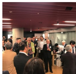
Nomu-nication: a networking event 飲む・ニケーション (会員同士のネット ワーキング)