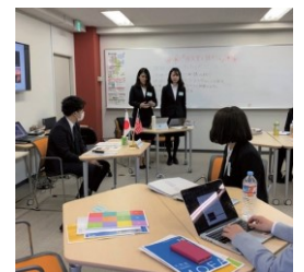
Study group for students 学生向けの勉強会