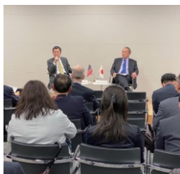
Monthly Lecture Program 月例の講演会や対談