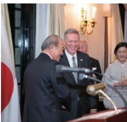
Reception at the U.S. Ambassador's Residence アメリカ大使公邸での レセプション

In addition to the NGRT, the America-Japan Society offers a variety of programs. By becoming a member of the Society, you will be able to participate in those events as well. You can apply for membership at the same time as you register for NGRT through the online form on the right page. 一般社団法人日米協会では、NGRT 以外にも様々なプログラムを開催しております。協会のメンバーに登録することで、そのようなイベントにも参加できるようになります。この機会にぜひ入会をご検討ください。